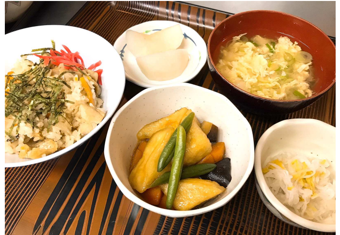
五目御飯にデザート用の梨。メニューも秋ですね。

メニューは五目御飯、オランダ煮、酢の物、みそ汁と、いただきものとうがんの煮物、梨、果物ゼリー。ありがたいことに今回もサポーターさんから食材の提供があり、こころもお腹もいっぱいになりました。 にぎやかな遊びのようす