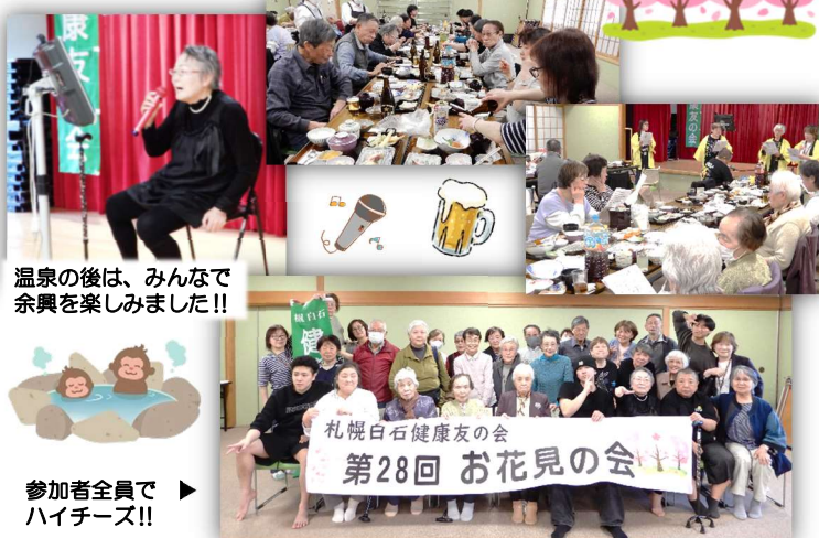
温泉の後は、みんなで余興を楽しみました!!