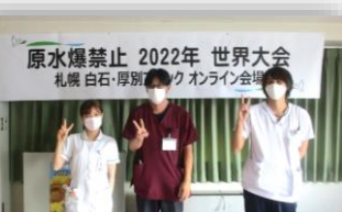
原水爆禁止 2022年 世界大会 札幌 白石・厚別・清田 オンライン会場