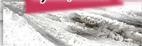
▲道路は深いわだちで、歩くのが大変です