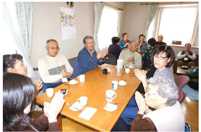
「ゲームで楽しむおしゃべりサロンひまわり」の参加者/昨年5月16日

白石区北郷にあるアパートの1階の部屋を借りて毎回20名ほどの参加者で食事、体操、ゲームなどで楽しんでいます。ゲームは年間を通して優勝者を表彰(景品付き)するなど、色々なアイデアを自分達で出し合いながら運営しています。