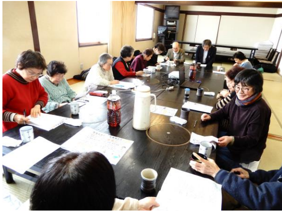
（菊水南西の地域交流会 2月22日）

「健康相談会」は今年度合計で90 回の開催となり、年度目標には10回 分届きませんでした。昨年より32 回増えました。「地域交流会」では、 9月と10月の月間で聞き取りしたア ンケートを地域ごとに集約して説明 したり、友の会新聞の手配り活動で の苦労話など、地域の健康づくりの 話などが出されました。 また、札幌病院では1月末から2月 末まで「健診のお誘い」と「友の会員 の拡大」・「署名の訴え」でロビー行動 を行い、健康診断の利用者増に