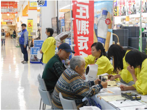
(9/28) アークス菊水店での 青空健康チェック

九月と十月の二カ月で取り組んできました『友の会活動拡大強化月間』が終了しました。協力していただいた友の会員の皆さん、大変お疲れさまでした。 今年の『強化月間』では、友の会に關連する民医連の院所・事業所の職員と共に『地域訪問』『健康相談会』『青空健康チェック』などに取り組みました。また、札幌病院一階待合に『友の会コーナー』を設け、職員と一緒に友の会への入会の訴えや署名のお願い、健康診断のお誘いを行いました。