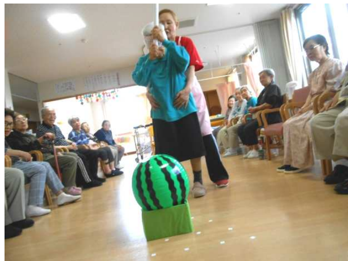
（大声援を受けてのスイカ割り）