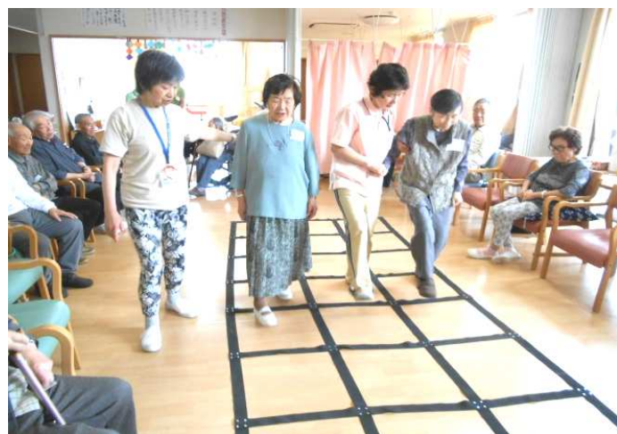
（「ふまねっと」ではマス目を踏まないようにね）

勤医協デイサービス花りん荘（かりんそう） ☎871-7780 札幌市白石区米里1条4丁目6-10