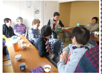
（輪投げを楽しむ参加者）