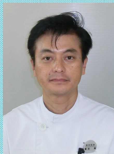
勤医協札幌歯科診療所