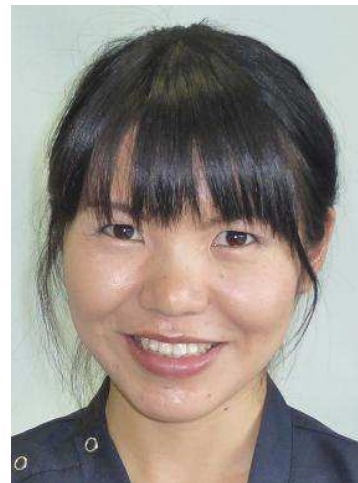
勤医協札幌病院 内科